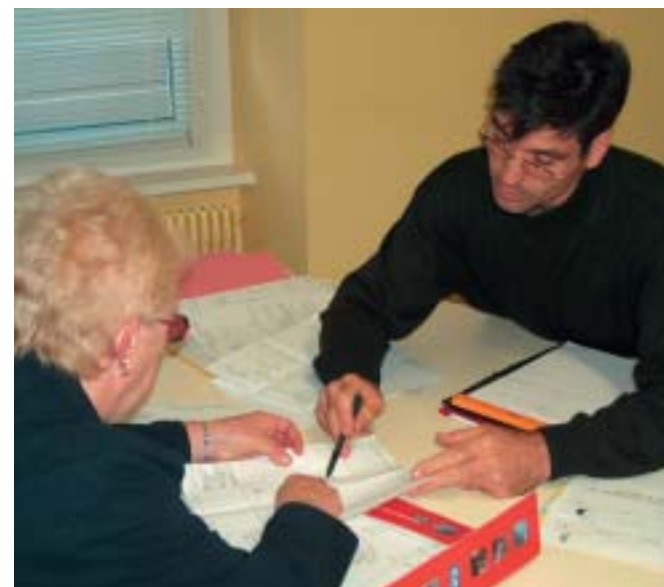
Permanence O.P.A.H. tenue dans les locaux de la Communauté de Communes

Définition d'actions publiques d'accompagnement de l'O.P.A.H., touchant les domaines de l'environnement urbain, en favorisant la création de logements sociaux dans le parc immobilier privé.