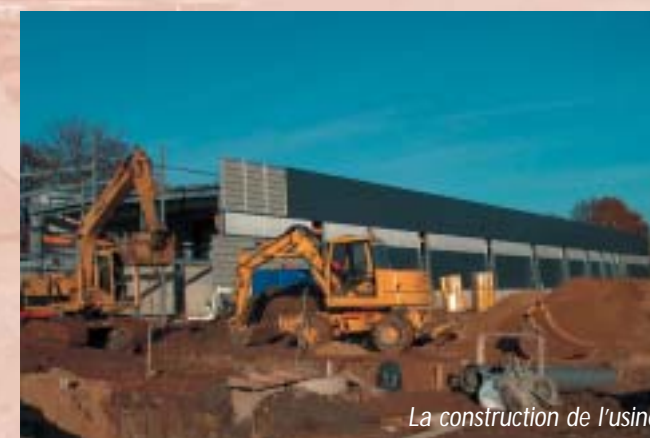
La construction de l'usine

de satisfaire sa clientèle. Ne pouvant réaliser d'extension sur son site actuel, les dirigeants de la société cherchaient des terrains viabilisés (sur ou en dehors