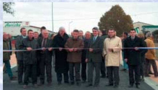
Inauguration du « Campus 3 » en présence de nombreuses personnalités.

Pour plus de renseignements, veuillez contacter la Communauté de Communes au 04 70 09 70 23.